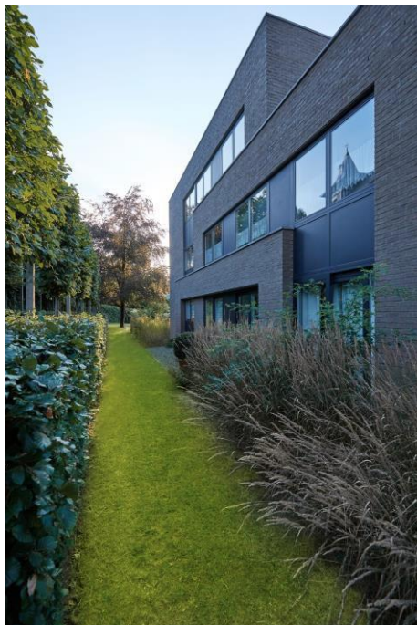
EMBOURG - BELGIQUE - 2013