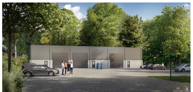
CHAUDFONTAINE - BELGIQUE - 2020

Il n'est pas permis à l'acquéreur d'effectuer lui-même, ou via des tiers, des travaux sur le chantier avant la réception provisoire. Si l'acquéreur effectue lui-même ou via des tiers des travaux au bien à l'insu du maître d'ouvrage, ceci vaut pour acceptation de la réception provisoire de ses parties privatives. Dans ce cas, l'entrepreneur et le maître d'ouvrage sont déchargés de toute responsabilité et garantie à l'égard de l'acquéreur en ce qui concerne les travaux du bien concerné. Toute forme d'entrée en jouissance vaut également pour acceptation de la réception provisoire.