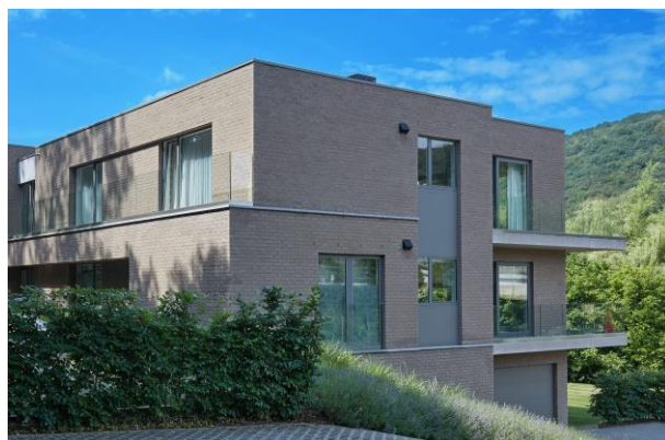
EMBOURG - BELGIQUE - 2014