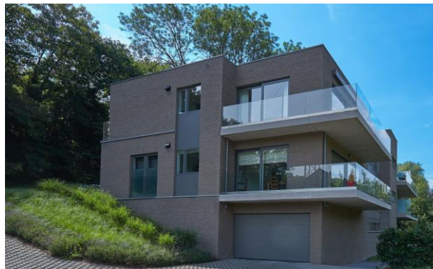
EMBOURG - BELGIQUE - 2014

Sauf demande expresse écrite de la part du syndic (en ce qui concerne les parties communes) ou de l'acquéreur (en ce qui concerne les parties privatives), la réception définitive est acquise automatiquement un an après la réception provisoire et marque la fin de période de garantie suivant les dispositions légales en la matière. Cette réception définitive a pour objectif de vérifier si aucun vice caché n'a été découvert pendant cette période d'un an et si toutes les observations de la réception provisoire ont effectivement été levées.