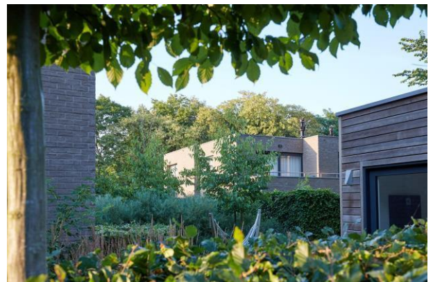
EMBOURG - BELGIQUE - 2013

Chaque appartement est équipé d'un compteur individuel de la compagnie de distribution, installé dans une pièce des compteurs commune au sous-sol.